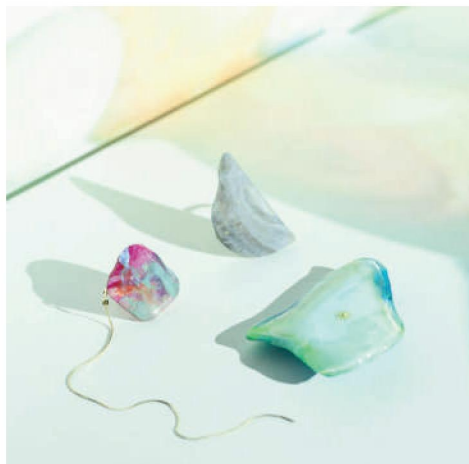
Leon art jewelry created by 海と梨

着る人に創造性を与えることを目的とし、「Empowering Creatives」を理念とする気鋭のユニセックスブランド。テラリングとワークウェアの要素をミニマルな世界観によって再構築したスタイルを提案します。今回は、既存の世界観を保ち、新たな要素を取り入れた 22SS コレクションを発表します。